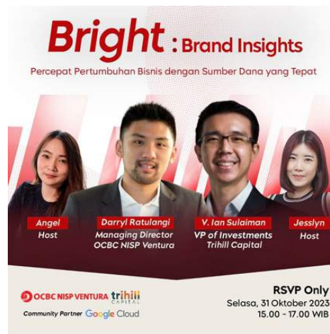
Talkshow Bright:Brand Insights bekerja sama dengan Trihill Capital, bertemakan "Percepat Pertumbuhan Bisnis dengan Sumber Dana yang Tepat" 31 Oktober 2023