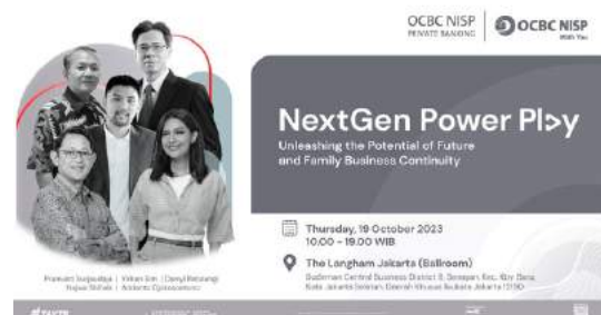
Talkshow NextGen PowerPlay bertemakan "Unleashing the Potential of Future and Family Business Continuity" yang diadakan bekerjasama dengan PT Bank OCBC NISP Tbk Private Banking 19 Oktober 2023