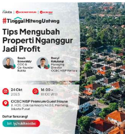
Talkshow bekerja sama dengan Rukita dan PT Bank OCBC NISP Tbk bertemakan "Tips Mengubah Properti Nganggur Menjadi Profit" 4 Oktober 2023