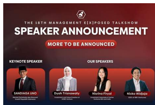
Talkshow The 18th Management E(x)posed bertemakan "Introduction to Venture Capital" yang akan diadakan bekerja sama dengan Universitas Indonesia 7 Desember 2023

Selain dari program di atas, Perusahaan juga melaksanakan program CSR pada tanggal 14 Oktober 2023 dengan memberikan bantuan kepada petani kopi di Ciwidey yang bertujuan memberikan dukungan lebih lanjut dalam pemberdayaan ekonomi (program kopi) dan meningkatkan pendapatan penduduk desa. Untuk itu, selama tahun 2023 Perusahaan telah berhasil melaksanakan 2 (dua) event kompetisi dan telah berpartisipasi di 8 (delapan) event seminar yang bekerja sama dengan pihak ketiga. Sehingga, Perusahaan telah mencapai target pelaksanaan program dalam aspek sosial yang ditentukan.