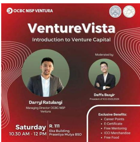
Webinar VentureVista bekerja sama dengan Universitas Prasetya Mulya, bertemakan "Introduction to Venture Capital" 14 Oktober 2023