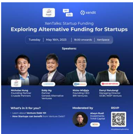
Talkshow XenTalk: Startup Funding bekerja sama dengan Xendit, bertemakan "Exploring Alternative Funding for Startups" 16 Mei 2023

Selain event kompetisi, Perusahaan juga berpartisipasi menjadi pembicara dalam acara-acara yang berhubungan dengan edukasi dan literasi keuangan. Perusahaan melihat kegiatan tersebut cukup baik dan akan diadakan setiap tahun sehingga dapat juga menjadi program yang secara tidak langsung meningkatkan kehidupan sosial dan kesejahteraan masyarakat yang menunjang pemberdayaan UMKM. Sepanjang tahun 2023, Perusahaan melaksanakan program pemberdayaan serta literasi keuangan untuk early-stage startup yang masih di tahap seed dan dapat dikategorikan sebagai UMKM, melalui berbagai kegiatan edukasi keuangan yang menarik dan sesuai kebutuhan dalam rangka peningkatan inklusi keuangan, baik yang dilaksanakan sebagai program Perusahaan sendiri maupun dengan bekerja sama dengan rekan mitra perusahaan atau lembaga lainnya. Program tersebut diadakan melalui virtual workshop berupa webinar dengan rincian sebagai berikut: