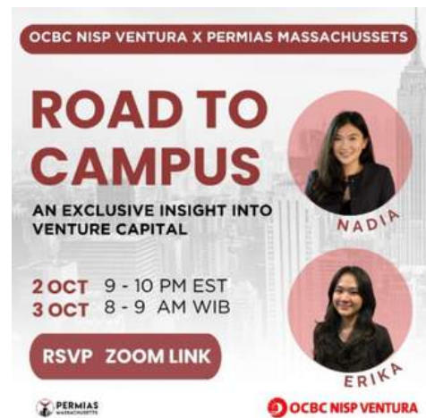
Webinar yang diadakan oleh Permas Massachusetts bertemakan "Introduction of Venture Capital" 3 Oktober 2023